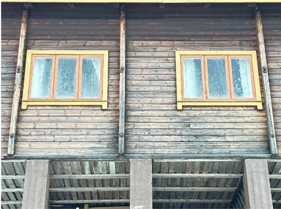
Bilde av vinduene på fasade mot nord-vest.