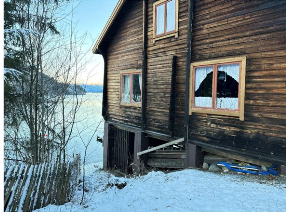
Bilde av vinduene på gavlveggen mot sør-vest. Vinduer i kammerset og kjøkkenet mangler vannbrett, i motsetning til vinduene i hemsen og salen.