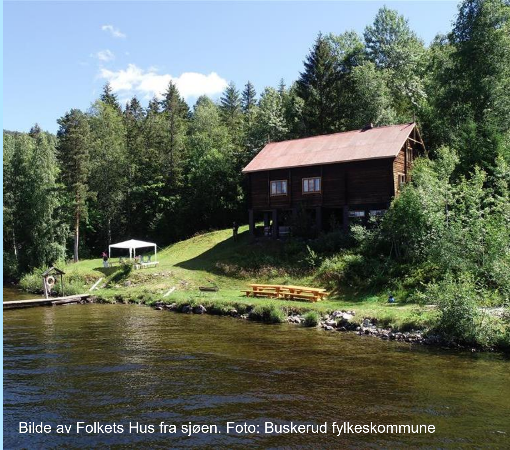
Bilde av Folkets Hus fra sjøen.