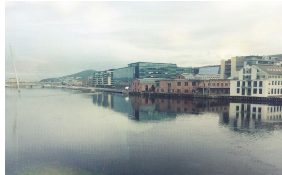
Nytt og gammelt langs Drammenselva. Kulturarven kan brukes som en ressurs i by- og tettstedsutviklingen.

Det er viktig at arbeidet innenfor dette satsingsområdet sees i sammenheng med andre regionale planer og strategier i Buskerud fylkeskommune, spesielt Regional plan for næringsutvikling og verdiskaping og Regional plan for areal og transport i Buskerud.