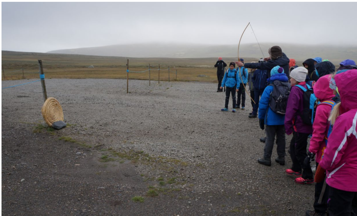
6-klassinger fra Hol kommune utforsker Hallingskarvet nasjonalpark på Skarveskolen i 2016. Dette er et tiltak i regi av Den kulturelle skolesekken.